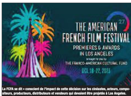
La FCFA se dit « conscient de l'impact de cette décision sur les cinéastes, acteurs, compositeurs, producteurs, distributeurs et vendeurs qui devaient être projetés à Los Angeles.

La FCFA se dit « conscient de l'impact de cette décision sur les cinéastes, acteurs, compositeurs, producteurs, distributeurs et vendeurs des films et séries qui devaient être projetés à Los Angeles du 18 au 22 octobre, pour la plupart pour la