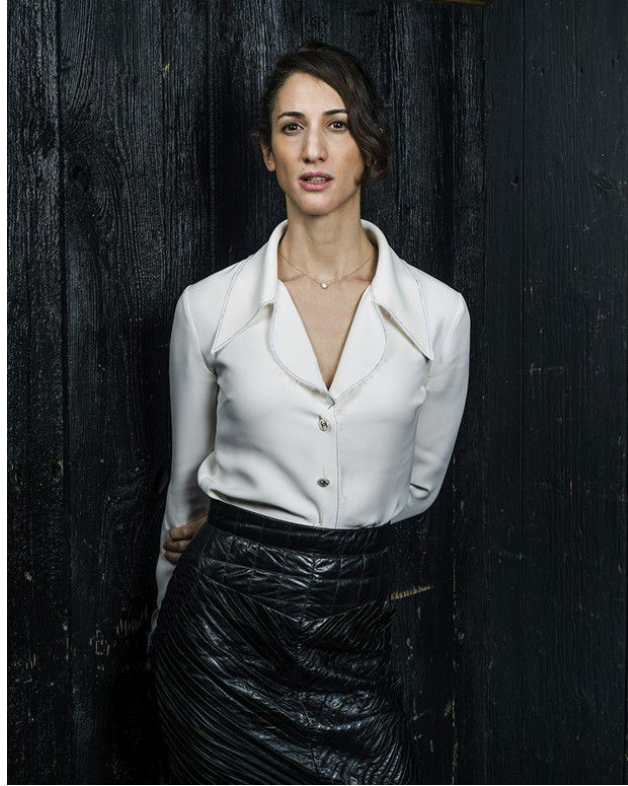
La réalisatrice Deniz Gamze Ergüven.

Quatre ans après la sortie de son dernier long métrage « Kings », tourné à Los Angeles, Deniz Gamze Ergüven, 43 ans, a tourné trois épisodes de la minisérie sur l'avocat américain Perry Mason pour HBO. « Il y a un esprit que j'aime beaucoup : c'est le côté ambitieux et l'envie de prendre les meilleurs. A la différence de l'Europe où l'on fait souvent des projets au rabais, on prend des risques et on met les moyens », commente la cinéaste franco-turque dont le film « Mustang » avait été choisi pour représenter la France aux Oscars en 2016. « Hollywood a toujours essayé d'attirer les talents des quatre coins du monde. La nouveauté, c'est que le pouvoir financier est passé entre les mains des plateformes. »